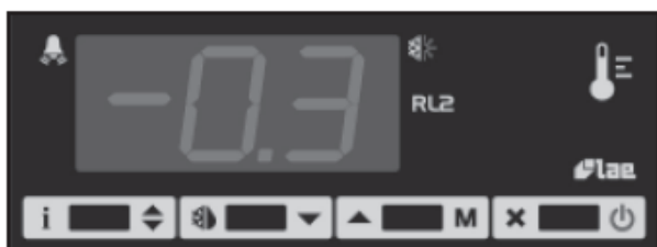
Fig.1 – Front panel